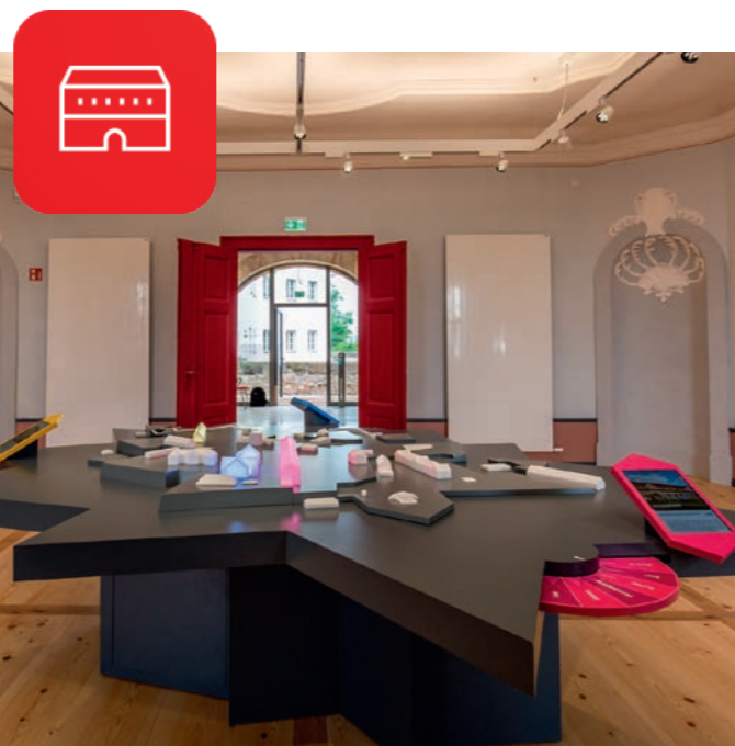
Interaktives Petersberg-Model | Stadtverwaltung Erfurt

Sowohl in der Ausstellung im Kommandantenhaus als auch auf dem Außengelände des Petersberges wird eine neue App die Besucher informieren. Die App begleitet Sie auf ihrem individuellen Petersberg-Erlebnis und bietet zusätzliche Audiobeiträge, Videos und noch einige überraschende Inhalte. Neben dem englischsprachigen Angebot können auch Inhalte zusätzlich in Leichter Sprache abgerufen werden. Die Nutzung der App ist kostenfrei.