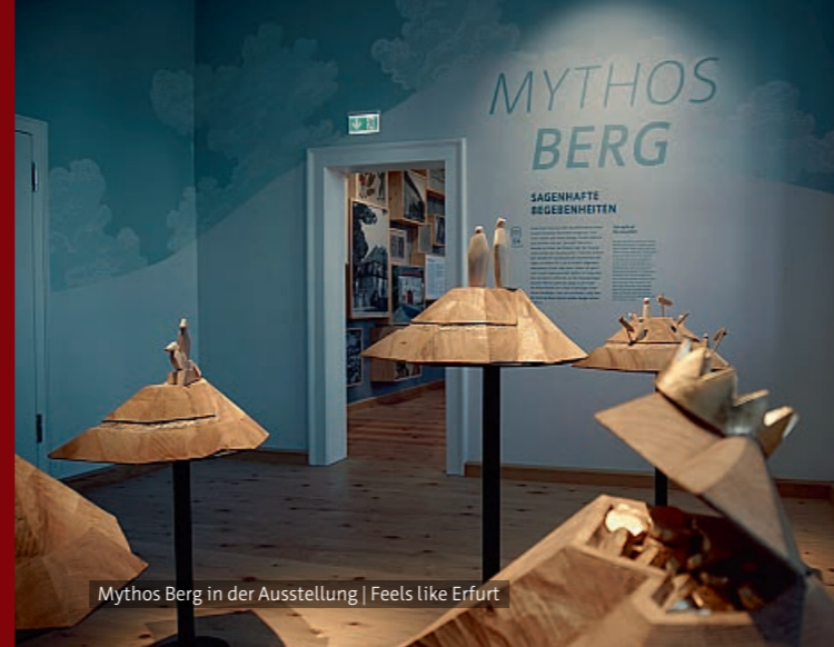
Mythos Berg in der Ausstellung | Feels like Erfurt

außer 24. und 31.12. 10.00–14.00 Uhr 25./26.12. und 1.1. geschlossen