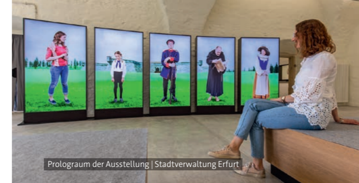
Prolograum der Ausstellung

Für Menschen mit eingeschränkter Mobilität sind diese beiden Führung nur bedingt geeignet. Wir empfehlen festes Schuhwerk und warme Kleidung. Die Temperatur in den Horchgängen beträgt ganzjährig ca. 10° C bis 15° C.