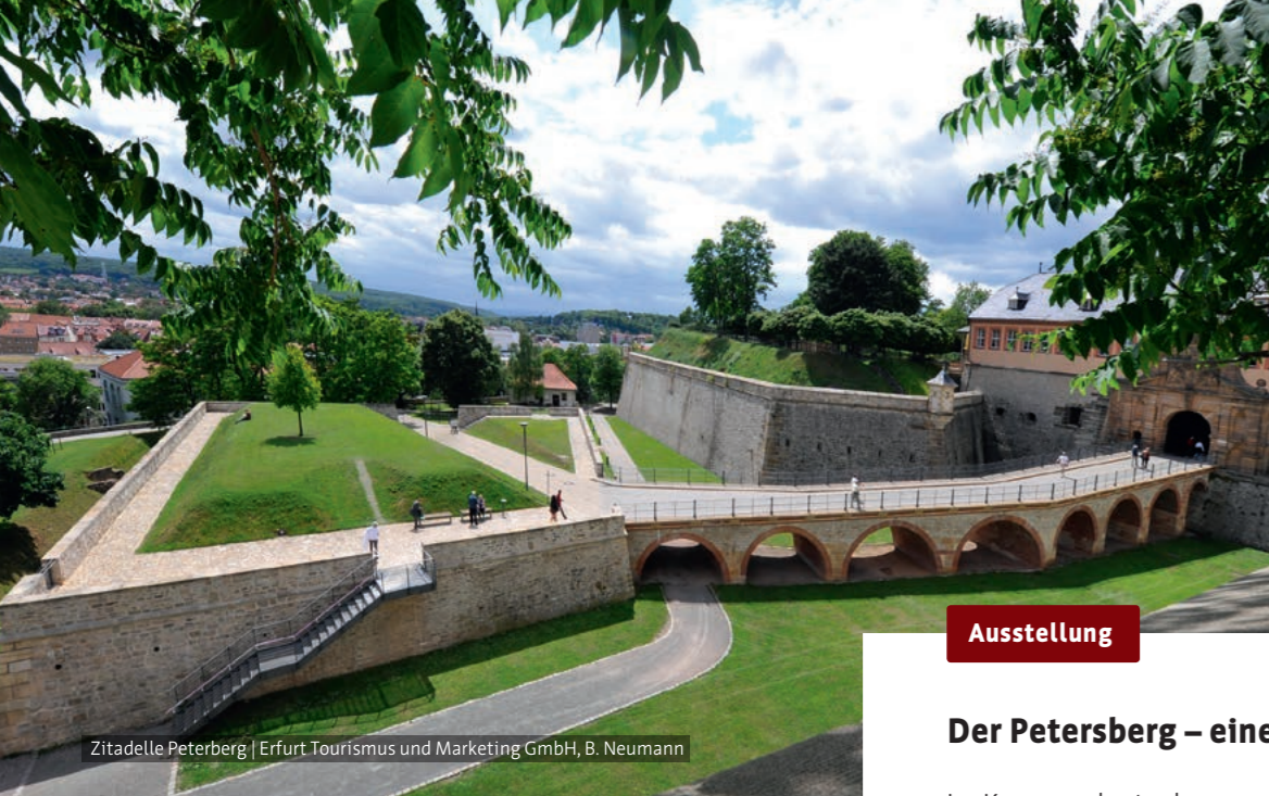
Zitadelle Petersberg