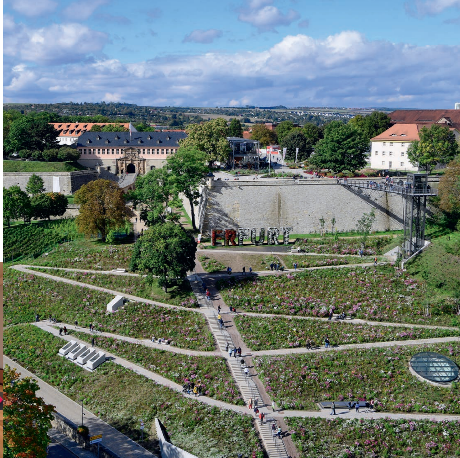
Der Petersberghang: Panoramaweg mit Panoramaaufzug

Über der Erfurter Altstadt erhebt sich die Zitadelle Petersberg – eine der größten und einzige weitgehend erhaltene barocke Stadtfestung Mitteleuropas. Sternenförmig angelegt, galt sie als die modernste Anlage der damaligen Zeit und als uneinnehmbar.