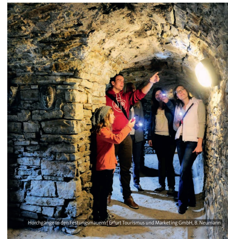
Horchgänge in den Festungsmauern

Die Dauer der Veranstaltung variiert jeweils. Für Schulklassen bieten sich die Besichtigung der Ausstellung im Kommandantenhaus und ein anschließender Workshop an, um Geschichte unterhaltsam zu vermitteln.